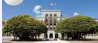
しいのき迎賓館 (旧石川県庁舎本館)