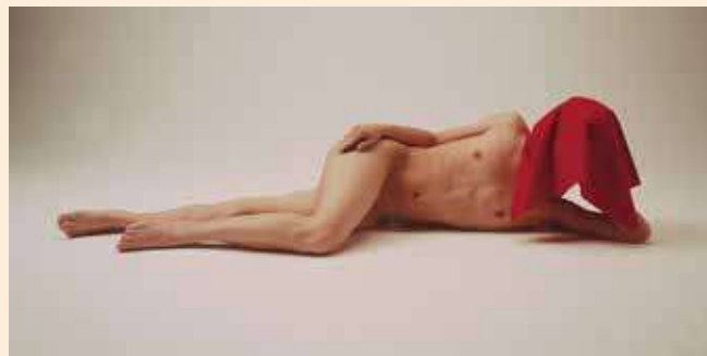
潘逸舟《無題》2006 ©Ishu Han, Courtesy of ANOMALY

本展覧会は、ゲストキュレーターのアーティスト・長島有里枝が、1990年代以降に活動を始めた10作家の作品について、フェミニズムの視点から新たな解釈可能性を見いだす試みです。