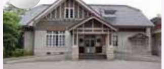
県立美術館広坂別館 (旧陸軍第九師団長官舎)