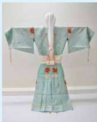
鎧直垂 (加賀本多家9代・本多政和の所用と伝わる)