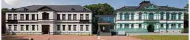
国立工芸館 (旧陸軍第九師団司令部庁舎・金沢銀行社)