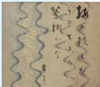
室生犀星自筆色紙 「梅の枝もたらせてある茶棚かな」