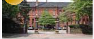
石川四高記念文化交流館 (旧第四高等学校本館)