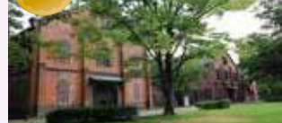
いしかわ赤レンガミュージアム (旧金澤陸軍兵器支隊兵器庫)