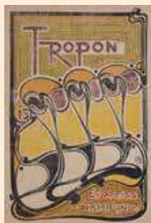
アンリ・ヴァン・ド・ヴェルド《トロポン》 1898年頃 東京国立近代美術館蔵

アール・ヌーヴォーの時代を代表するアンリ・ヴァン・ド・ヴェルドやアルフォン・ス・ミュシャの作品、そして、初代宮川香山や杉浦非水など、同時代の日本の工芸やデザインの展開をご紹介します。多様な作品を通じて、異なる文化が出会い、めぐりめぐって互いに響きあうダイナミズムを感じてください。