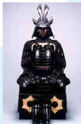
黒漆塗黒糸威二枚胴具足 前田利政所用