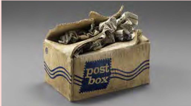
三島喜美代 (Work-86-B) 1986-87年 東京国立近代美術館蔵

東京国立近代美術館が所蔵する国内外の優れた工芸・デザイン作品を中心に、あえて工芸と括らずに新しい視点でご紹介する展覧会です。器からオブジェまで形状はさまざまですが、鑑賞者はジャンルを気にすることなく、工芸素材とそれを活かす卓越した技術を用いた幅広い表現に触れることができるでしょう。