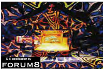
デジタル掛軸イメージ

10.1 [土] 13:30 デジタル掛軸 開始 14:30 開演(~16:00頃)