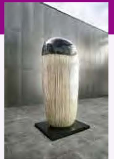
金子潤《Untitled (13-09-04)》2013年