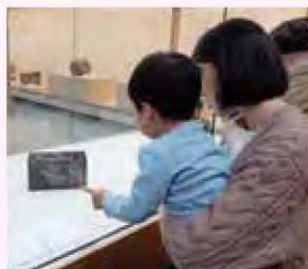
昨年度の鑑賞会より