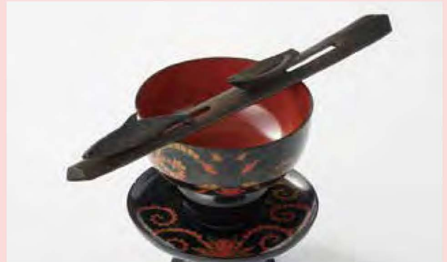
捧酒箸(逃げるシャチと追いかける舟)北海道博物館蔵

「アトウイ」はアイヌ語で「海」。アイヌにとって海は生業の場であり、外の世界と繋がる交易の道でもありました。北前船による蝦夷地と本州の産物往来にも、アイヌが深く関わります。