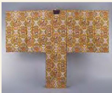
おきなりぎぬ 翁狩衣 ことぶきし なな たけこうしほうおうまるまりまくもよう 寿字に斜め竹格子鳳凰丸桐菊模様 彦根城博物館所蔵

金沢の伝統芸能のひとつである「加賀宝生」。江戸時代の頃から宝生流の能が盛んな加賀藩を象徴する前田家伝来の能装束61点と能面15点を紹介します。幕末の藩主と能の関わりを考えながら、地方独自の発展を遂げた加賀藩の能楽史をふりかえります。