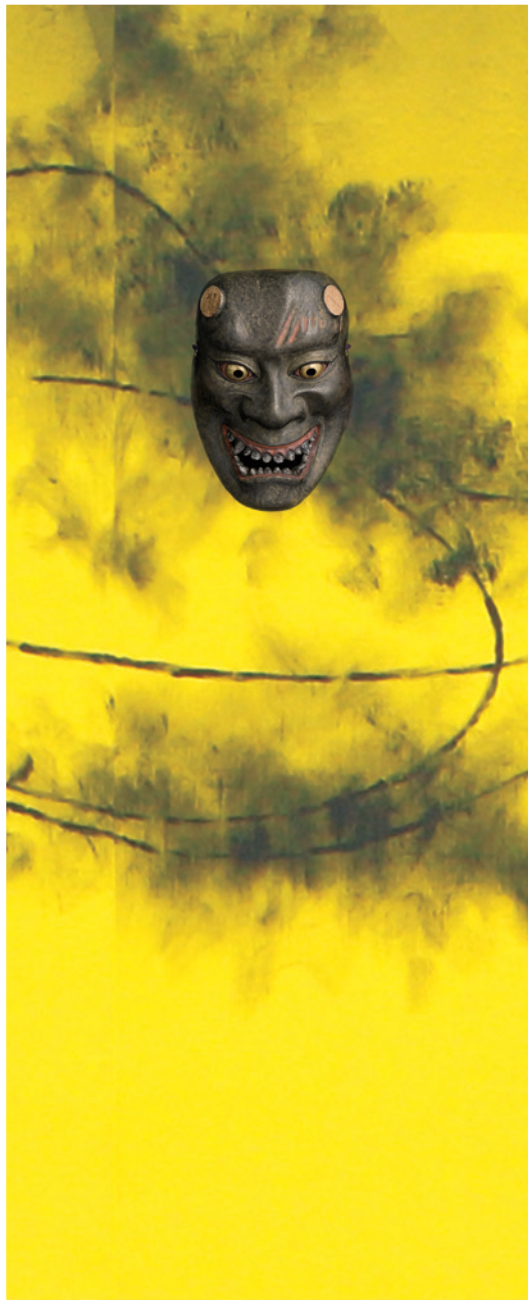
Photo / Noh Masks: YAMAZAKI Kenji / Serigraph-panel / Serigraph: Ohtsuka Kouhan, Wooden panel: Daiwa Sangyo